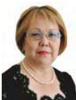
Гульнара Рыспекова, судья Верховного Суда Республики Казахстан, исполнительный директор Республиканской нотариальной палаты