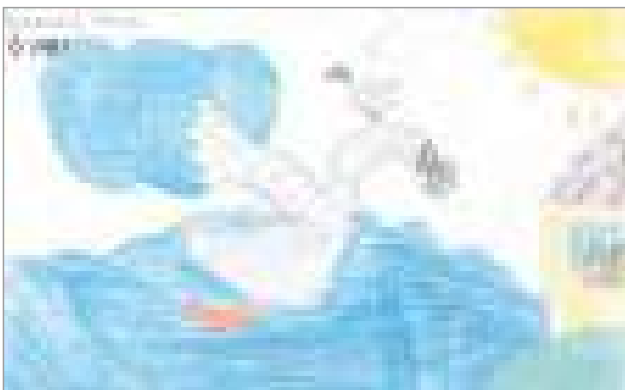
Аниса Қалдыбай, 6 лет