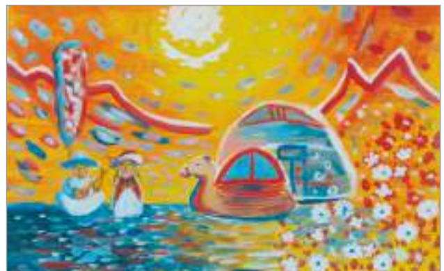
Аружан Жексембай, 14 лет